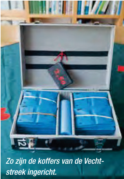
Zo zijn de koffers van de Vechtstreek ingericht.