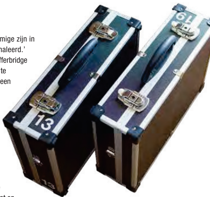
Klaar voor vertrek.